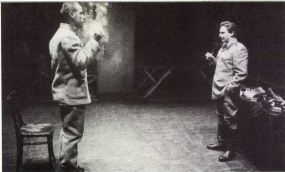
A legjobb új magyar dráma: Eörsi István: A kihallgatás. A felvétel a kaposvári Csiky Gergely Színház előadásáról készült

Eszenyi Enikőé az évad legnagyobb kiugrása, epizódban is, főszerepben is: mellékszereplőként az Éjjeli menedék helyben meg a Körmagyarban , főszereplőként a Pantaleóban és a Dupla vagy semmiben . Csodálatos mellékszereplő volt A hatyúban Tolnay Klári, kiváló volt a Kutyaszívben Csomós Mari, remek volt a Vízkeresztben Szirtes Ági, a Körmagyarban Igó Éva.